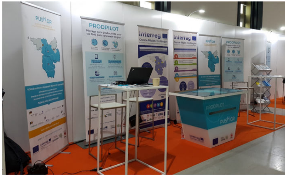
Screenshot des interaktiven Tisches auf der Messe „#GEN“, September 2021

Das Projekt PRODPILOT hat im zweiten Jahr der Projektlaufzeit ein Antrag auf Kapitalisierung gestellt. Dieser Antrag auf große Änderung des Projekts besteht darin, sich mit einem weiteren INTERREG-Projekt, PUSH.GR (bei denen die htw saar ebenfalls federführende Begünstigte ist), zusammenzuschließen, um einen interaktiven Tisch anzuschaffen, mit dem die Projekte bei Netzwerkveranstaltungen, Messen und anderen öffentlichen Veranstaltungen besser beworben werden können.